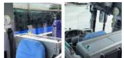
運転席後部 飛沫防止板 (イメージ)

また、貸切・観光バスにおきましては、運転席後部に飛沫防止板の設置を進めております。