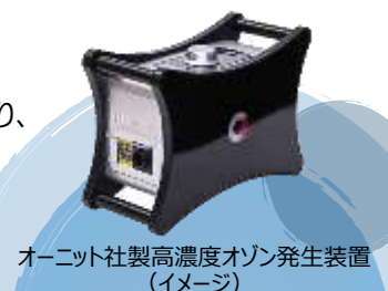
オーニット社製高濃度オゾン発生装置 (イメージ)

お客様のバスご乗車時にはオゾンは残留しておりませんので、安心して 貸切・観光・乗合高速バスをご利用いただけます。