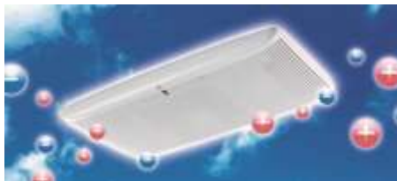
プラズマクラスターイオン発生イメージ