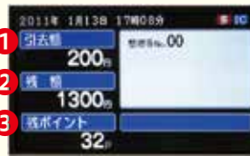
【運転席付近の表示画面】