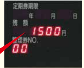
【カードリーダー表示】

正常な場合、“ピッ”と鳴り、青く 点灯します。 (赤く点灯した場合はエラーです。 もう一度タッチしてください)