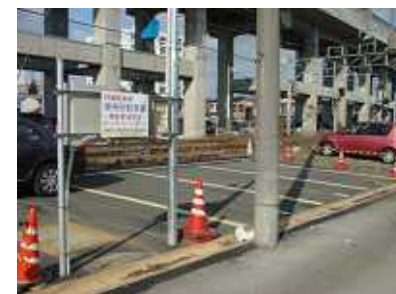
立川総合病院方面