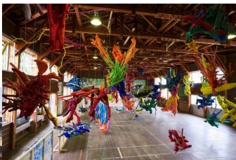
鉢&田島征三 絵本と木の実の美術館