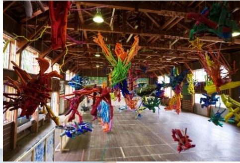
鉢&田島征三 絵本と木の実の美術館