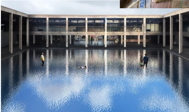
レアンドロ・エルリッヒ 作品イメージ 2018proposal (越後妻有里山現代美術館 [キナーレ] 内)