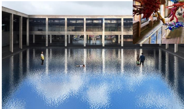
レアンドロ・エルリッヒ 作品イメージ 2018proposal 越後妻有里山現代美術館 [キナレ] 内